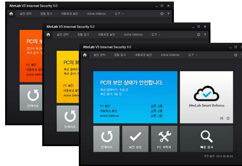
[V3 Internet Security 9.0 메인 화면]

AhnLab V3 Internet Security 9.0은 3가지 컬러로 보안 상태를 한눈에 확인할 수 있으며 핵심 기능을 메인 화면에서 간편하게 이용할 수 있습니다. 복잡한 옵션 기능도 단순화해 쉽고 편리하게 사용할 수 있습니다.