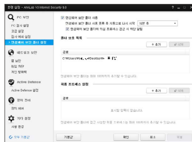
[랜섬웨어 보안 폴더 설정]